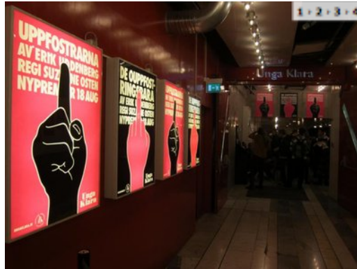
Au théâtre Unga Klara.